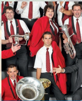
Brass Band MG Hörhausen

Eintritt: Fr. 20.— pro Person / Fr. 10.— Kinder und Jugendliche bis 16 Jahre (keine nummerierten Plätze)